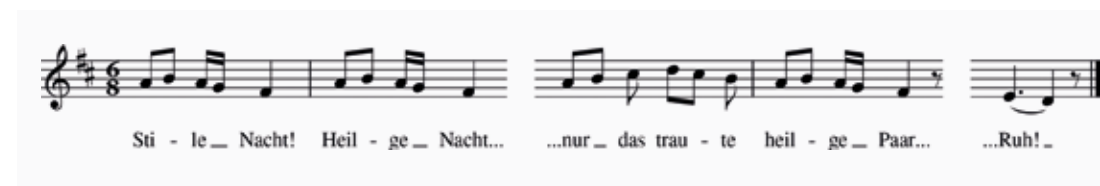
Abb. 10 Interessante Abweichungen einer auf der Originalfassung basierenden Abschrift aus dem Salzburg Museum

Deutschen Volksliedarchivs 33 und wurde in Polen (4), Ungarn (1) und der Schweiz (1) in den späten 1970er-Jahren aufgezeichnet. Die polnischen Varianten 34 zeichnen sich insbesondere durch Glättung des Rhythmus weg vom ‚wiegenden‘ Siciliano und vor allem ab Takt 9 durch rhythmische Änderungen aus, die auf die melodische Gestalt Einfluss haben, mitunter aber auch nur dem Duktus der Fremdsprache geschuldet sein mögen. Interessant ist auch die Gestaltung der Mehrstimmigkeit, die in einer Variante aus Krasnobród/Hutków 1977 etwa ausschließlich Terzen 35 , in einer Aufzeichnung aus Krasnobród/Podklasztor ein Jahr später relativ viele leere Quinten bringt, was auf ein anderes Klangideal schließen lässt. Abbildung 9 vergleicht einige interessante Details der polnischen Fassungen mit der Rezeptionsfassung. Die polnischen Varianten, die vornehmlich im 3/4-Takt stehen und augmentiert sind, wurden zur besseren Vergleichbarkeit diminuiert, an den 6/8-Takt angepasst und