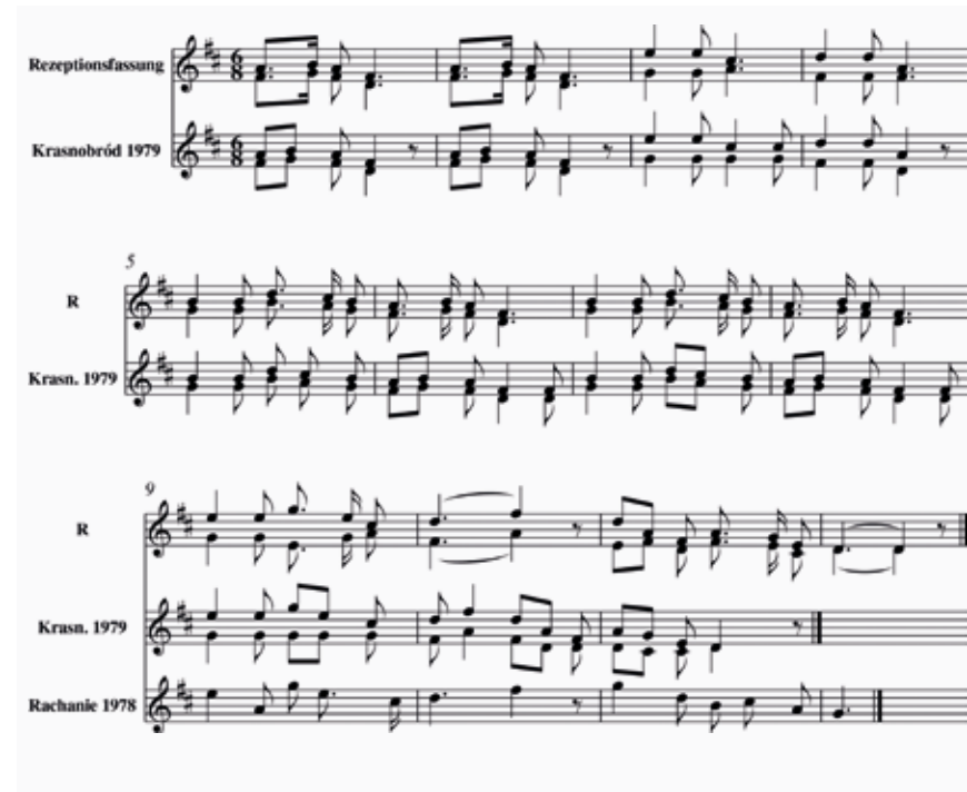
Abb. 9 Vergleich der polnischen Aufzeichnungen aus dem DVA mit der Rezeptionsfassung

Deutschen Volksliedarchivs 33 und wurde in Polen (4), Ungarn (1) und der Schweiz (1) in den späten 1970er-Jahren aufgezeichnet. Die polnischen Varianten 34 zeichnen sich insbesondere durch Glättung des Rhythmus weg vom ‚wiegenden‘ Siciliano und vor allem ab Takt 9 durch rhythmische Änderungen aus, die auf die melodische Gestalt Einfluss haben, mitunter aber auch nur dem Duktus der Fremdsprache geschuldet sein mögen. Interessant ist auch die Gestaltung der Mehrstimmigkeit, die in einer Variante aus Krasnobród/Hutków 1977 etwa ausschließlich Terzen 35 , in einer Aufzeichnung aus Krasnobród/Podklasztor ein Jahr später relativ viele leere Quinten bringt, was auf ein anderes Klangideal schließen lässt. Abbildung 9 vergleicht einige interessante Details der polnischen Fassungen mit der Rezeptionsfassung. Die polnischen Varianten, die vornehmlich im 3/4-Takt stehen und augmentiert sind, wurden zur besseren Vergleichbarkeit diminuiert, an den 6/8-Takt angepasst und