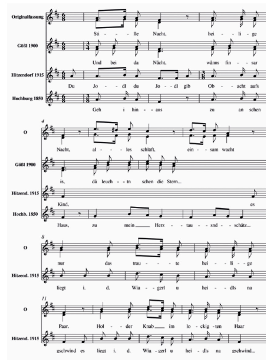
Abb. 11 Fragmente von „Stille Nacht“, in anderen Liedern im Vergleich mit der Originalfassung

Nicht nur die unter den taktweisen Änderungen bereits