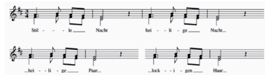
Abb. 5 Zusätzliche Melismen in einem Druck aus Regensburg 1856

Klangeindruck beitragen, etwa wenn sie dem heute gewohnten Hörbild entgegenlaufen (z.B. leere Quinten in den Oberstimmen in der Rezeptionsfassung in Takt 9). Das Gros der erhobenen Versionen entfällt jedoch auf Abschriften und Nachdrucke, in denen sich beinahe keine und wenn, dann denkbar marginale Abweichungen zu einem der konstatierten vier Grundtypen feststellen lassen (32).