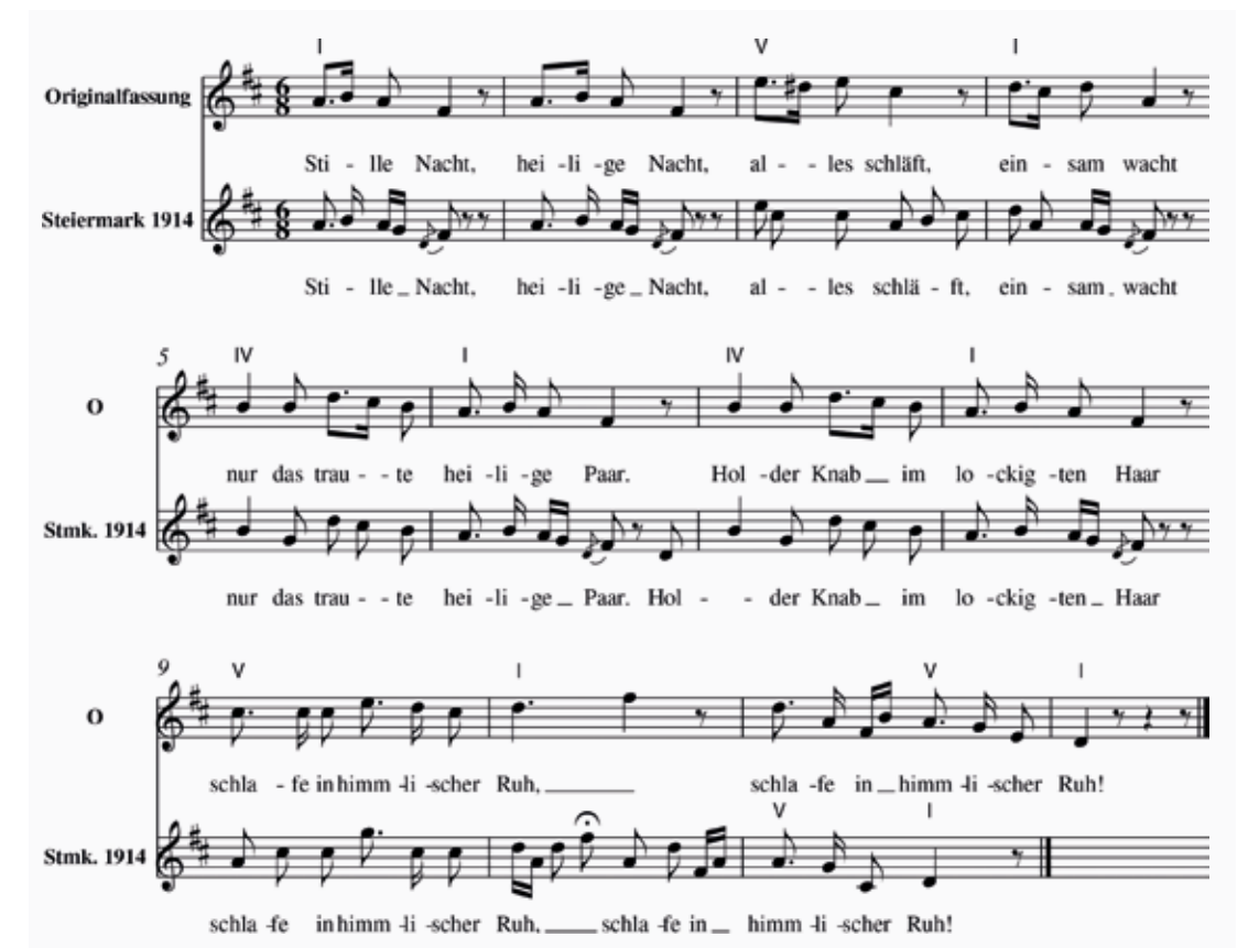
Abb. 8 Vergleich der Murrauer Aufzeichnung von 1914 mit der Originalfassung

Namen und Orte ausgetauscht, Nebenhandlungen verworfen oder neu hinzugedichtet werden, oder auch einmal ein Jodler anstelle eines Gesätzes auftaucht 31 , ändert sich in den untersuchten Melodievarianten meist wenig mehr als der Umstand, welche Textpassagen je Fassung zwischen Wiederholungszeichen gesetzt werden. So ist auch erklärlich, warum das ursprüngliche harmonische Gerüst in einer