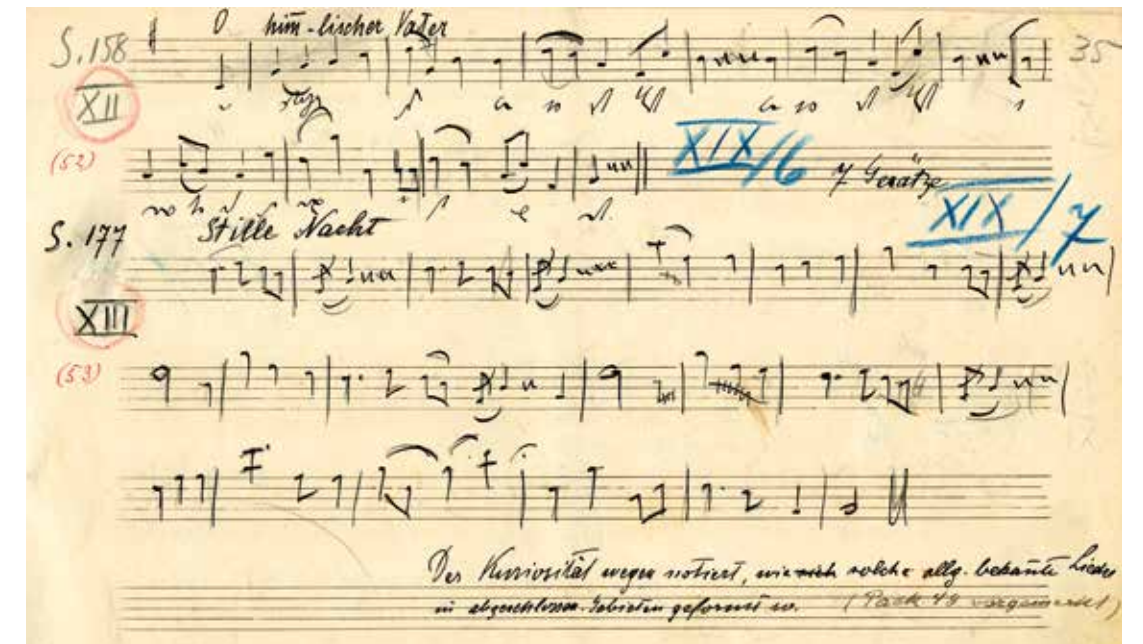
Abb. 7 Aufzeichnung aus dem Bezirk Murau von 1914

Die ‚klassische‘ Form der Variante, mit der sich die Volksliedforschung beschäftigt, resultiert daraus, dass ein Lied bereits unmittelbar nach seiner Schöpfung weitergegeben wird und sich während dieses noch im 19. Jhd. sehr oft mündlichen Tradierungsprozesses gleichsam ‚unabsichtlich‘ verändert – Silben werden zusammengeführt, verschliffen, neue Melismen bilden sich aus, Strophen wechseln ihre Reihenfolge oder sogar das Lied (= Wanderstrophe). Diese Form der Variantenbildung ist im Fall von Stille Nacht allerdings – vergleicht man es mit anderen Volksliedern jener Zeit, wie sie uns etwa in der Sonnleithner-Sammlung von 1819 oder in der ersten gedruckten Salzburger Volksliedsammlung von 1865 vorliegen – nicht sehr ausgeprägt. Dies