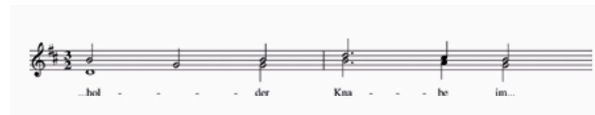
Abb. 6 Zusätzliche Melismen in einer auf der Zillertaler Fassung basierenden Fassung aus Rumänien um 1860

um 1850 24 weisen sogar die Originaltonart D-Dur auf, enden aber im Schlusstakt nicht auf dem Grundton, sondern auf der Terz, was von den Grundtypen her ausnahmslos der Zillertaler Fassung eignet. Eine ebenfalls auf die Originalfassung zurückgehende Abschrift von Thomas Fermüller (1799–nach 1856) um 1840 25 weist wiederum die Dur-Terz am Schluss auf, beendet aber darüber hinaus Takt 4 auf dem Wort „wacht“ mit einer absteigenden Sext auf das fis', statt wie üblich auf das a'. Die Besonderheit weiterer Varianten besteht darin, dass sie einzelne Takte durch zusätzliche Melismen ausschmücken.